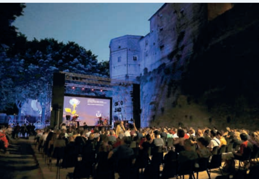
La tappa santarcangiolese della Milaneseana, che ha portato allo Sferisterio Dario Vergassola e i Modena City Ramblers

Oltre agli enti promotori della rassegna estiva – Amministrazione comunale e Fondazione Culture Santarcangelo – sono state circa una trentina le associazioni e oltre 200 gli artisti coinvolti nel calendario di 47 giornate, che nel corso del periodo estivo hanno occupato l'arena Sferisterio con eventi dedicati al teatro, alla poesia, alla musica, alla storia locale, alla cinematografia.