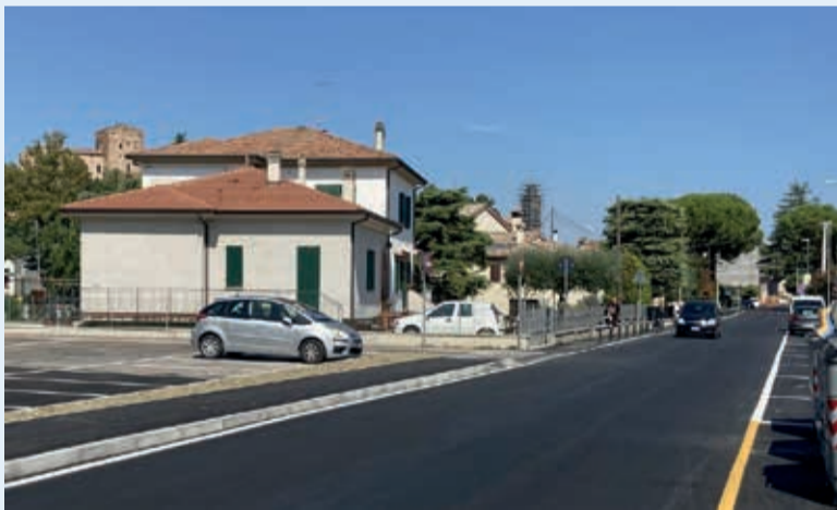
I nuovi stalli di sosta e il percorso protetto realizzati in via Togliatti

Sono quasi ultimati i lavori per la realizzazione del percorso ciclopodale in sicurezza e la riorganizzazione dei parcheggi in via Togliatti nel tratto di fronte alla scuola dell'infanzia Margherita.