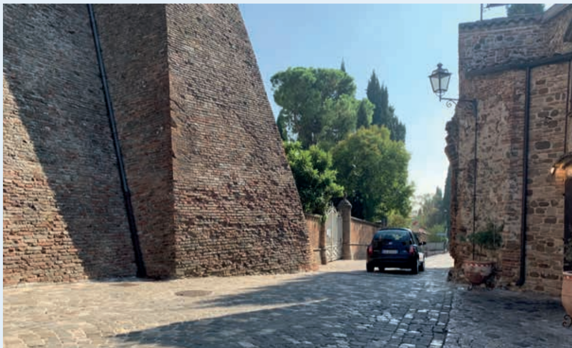
L'ingresso alla ztl di via della Rocca

zione per nessuno", prosegue Sacchetti. "È per questi motivi – conclude l'assessore alle Politiche per la sicurezza – che nei giorni scorsi la Giunta comunale ha approvato le necessarie modifiche al Regolamento sul traffico veicolare nelle zone a traffico limitato, specificando che per tempo massimo di permanenza si intende sia la fase di circolazione che quella della sosta".