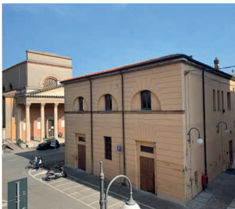
Il palazzo della ex biblioteca che ospiterà la Casa della poesia e il Visitor center

Il progetto prevede una spesa di 500mila euro per la copertura, fra gli altri, dei costi relativi agli interventi archivistici e la catalogazione della