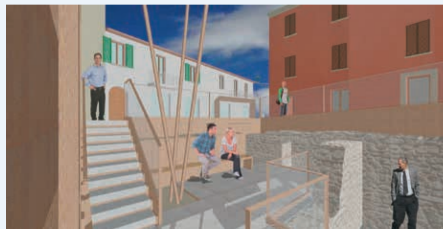
Il rendering dei lavori che saranno realizzati in piazza Balacchi

Confermata dunque l'apertura del cantiere entro l'anno – una volta terminate le procedure riguardanti la gara per l'affidamento dei lavori – l'intervento di restauro e riqualificazione consentirà di far conoscere e valorizzare una delle scoperte più