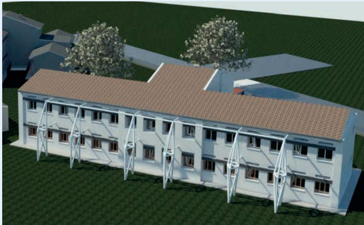
Il rendering dell'intervento che interesserà la palazzina A della scuola media Saffi

I lavori alla palazzina A della Saffi, dal costo complessivo di 720mila euro, potranno contare su un contributo di 500mila euro del Ministero dell'Istruzione, dell'Università e della Ricerca.