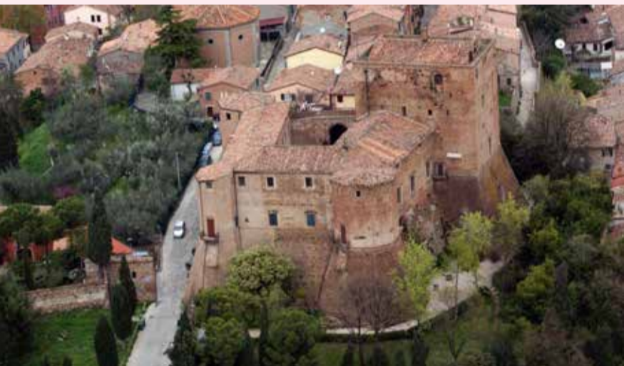
La Rocca Malatestiana di Santarcangelo

Subito dopo la laurea, ha orientato in modo prevalente il proprio percorso professionale verso l'ambito museale, seguendo corsi formativi sui temi della valorizzazione, fruizione e comunicazione dei beni culturali e collaborando con il Museo della Città di Rimini per lo svolgimento delle lezioni didattiche e dei laboratori e con il Museo Civico Archeologico di Verucchio. Nell'ambito della collaborazione con Verucchio, ha svolto incarichi di guida, responsabile dei servizi educativi, curatrice, fino al ruolo di direttrice, ideando e organizzando eventi, scavi, curando mostre e pubblicazioni didattiche e scientifiche, nonché attività di promozione e scambi con altre istituzioni museali e di ricerca.