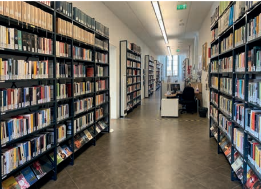
Il secondo piano della biblioteca Baldini

Sempre dedicati ai più piccoli, tornano i laboratori e le letture animate di "Santarcangelo per i bimbi" (domenica 17 e sabato 30 ottobre e domenica 21 novembre), mentre grazie al gruppo di volontari ABS | Amici Biblioteca Santarcangelo sono in programma gli appuntamenti della "Baldini 2.0".